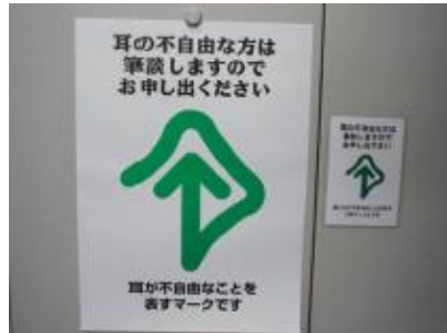
左 ポスター(A3) 右 表示板用カード