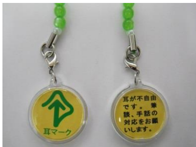
左 表面 右 裏面