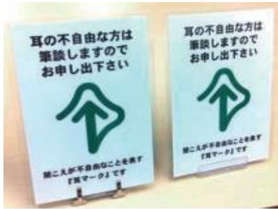
ステンレス(左) プラスチック(右)