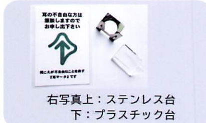
表示板用カード……200円 表示板用台……1個 110円