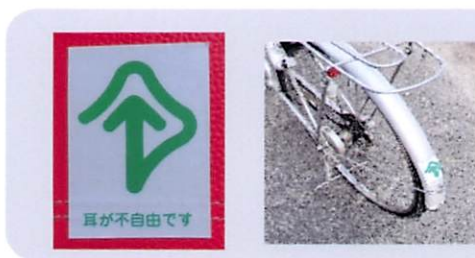
耐水性ステッカー (縦7cm×横5cm) 250円