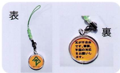
ストラップ(円形2.9cm) 410円