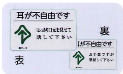
カードA (縦5.5cm×横8.5cm) 200円