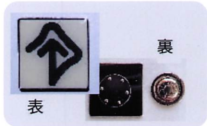
マグネット式バッジ (縦2.8cm×横2.8cm) 800円