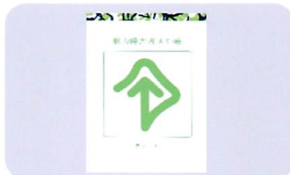
メモ帳(A6版100枚綴り) 200円

本カタログは全難聴の カタログを使用していますが、 販売品も価格も同じです。 岡山県の方は是非とも 岡山県難聴者協会へ お申し込みください。