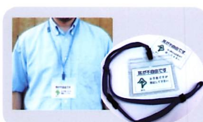
ネックホルダーのセット カードAまたはB 410円