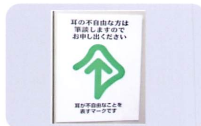
A3のポスター(297mm×420mm) 1枚 100円