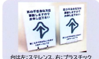
表示板セット(縦15.3cm×横11.1cm) ラミネート加工のカード&台 310円