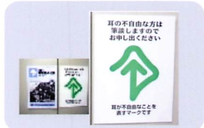
A4のポスター(210mm×297mm) 1枚 90円